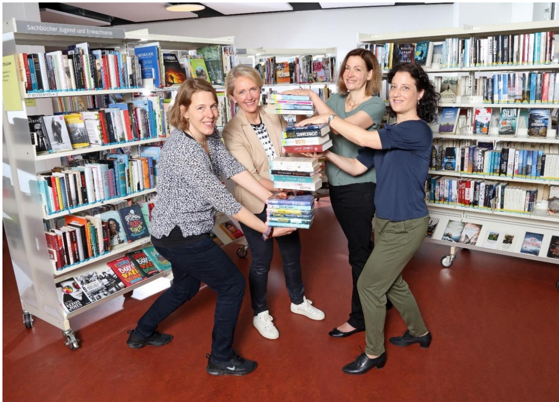
Das Team 2021